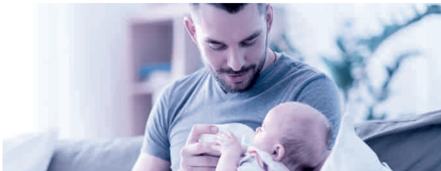
Vaterschaftsurlaub: innert sechs Monaten nach der Geburt zu beziehen.

Das Unternehmen muss dem Vater zehn arbeitsfreie Tage gewähren und hat für diese Zeit Anspruch auf 14 Taggelder. Es ist Sache des Arbeitgebers, bei der Ausgleichskasse – welche auch die EO-Beiträge abrechnet – den Antrag auf die Vaterschaftsentschädigung zu stellen. Der Antrag sollte aber erst gestellt werden, wenn der Arbeitnehmer den ganzen Vaterschaftsurlaub bezogen hat und der Arbeitgeber dies mit dem Antrag bestätigen kann. Die Auszahlung der Vaterschaftsentschädigung erfolgt dann nachgelagert