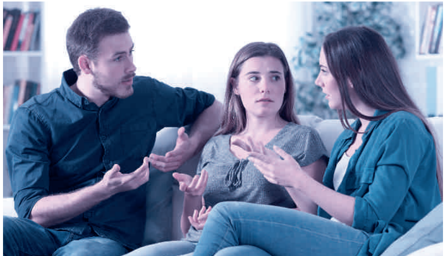
Kommt es zum Streit zwischen den Erben, muss der Willensvollstrecker schlichten.

Der Willensvollstrecker setzt den letzten Willen des Erblassers um. Dafür stellt er als Erstes ein Inventar auf, das er laufend nachführt. Er verwaltet die Erbschaft bis zur Teilung und muss darauf achten, dass das Vermögen erhalten bleibt. Er bezahlt die Schulden des Erblassers inklusive der Todesfallkosten und treibt offene Forderungen ein. Zur Verwaltung gehören auch die laufenden Geschäfte, beispielsweise muss er sich um den Unterhalt von Liegenschaften kümmern, laufende Verträge kündigen oder allenfalls die Liquidation einer Einzelunternehmung umsetzen. Er ist verantwortlich für die Erstellung der